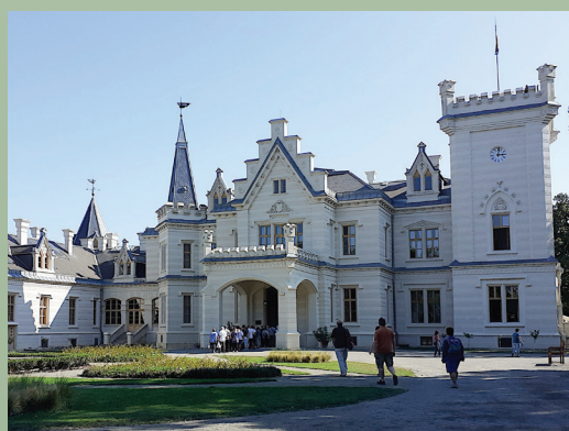
A nádasdladányi Nadasdy kastély

Még van hely az október 2-re tervezett buszkirándulásunkra! Ízelítőül képek a frissen felújított Nadasdy kastélyról, amit - többek között - látni fogunk: