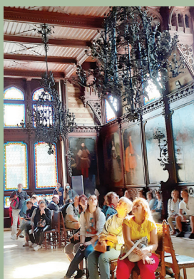
Az ősök terme

FONTOS: Helyi határidő: október 22. Megyei határidő: október 31.