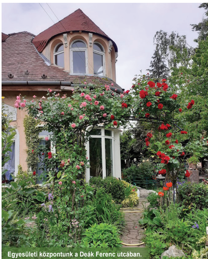
Egyesületi központunk a Deák Ferenc utcában.