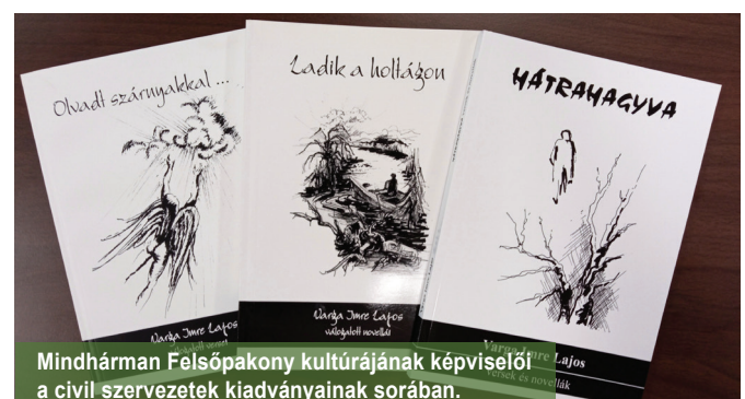
Mindhárman Felsőpakony kultúrájának képviselői a civil szervezetek kiadványainak sorában.