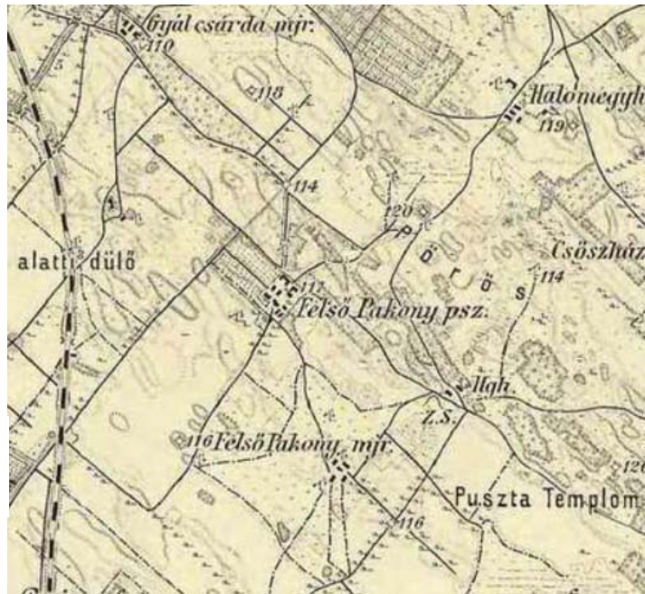
KIVÁGAT A III. KATONAI FELMÉRÉSBŐL-1880

A III. katonai felmérés már ábrázol lakott részeket, a körülöttük kialakuló különböző művelési ágakhoz tartozó területi egységekkel, úthálózatot és vasúti nyomvonalat.