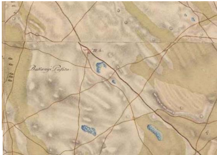
KIVÁGAT A I. KATONAI FELMÉRÉSBŐL-1784

Az I. katonai felméréstérképén-amely, a XVIII. végi állapotokat mutatja belátható, hogy a terület szinte teljesen lakatlan, a terület földjeit környező gazdák bérelték, művelték, a területre a Pakony pusztá felirat utal.