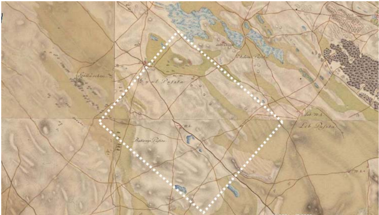
KIVÁGAT - I. KATONAI FELMÉRÉS, 1784

A térség vízrajzi sajátossága, hogy a Gödöllői-dombságból érkező patakok egymással párhuzamosan futnak a Duna-völgybe, azonban a község területét csak mesterséges csatornák érintik. A táj egészére jellemző a vízhiányos állapot a száraz éghajlat miatt.