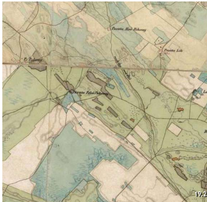
KIVÁGAT A I. KATONAI FELMÉRÉSBŐL-1784

A II. katonai felmérésén már jól láthatóak a közigazgatási terület középső részén mai is működő mezőgazdasági tanyás területek kezdeményei. A terület ekkorra sűrűbben lakott, mezőgazdasági tevékenység nyomai (kertek, majorságok, telepített erdők) már megtalálhatóak.